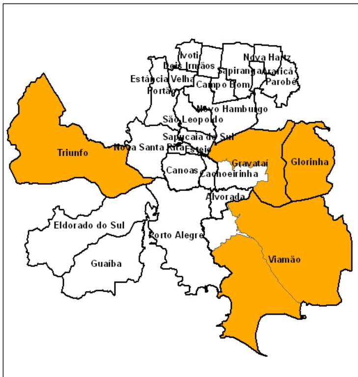
Figura 12 A